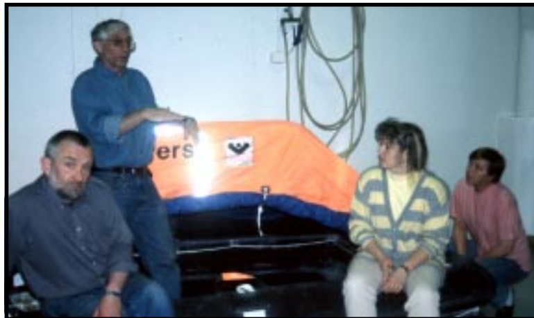
Fra et tidligere kurs i båtførerprøven.